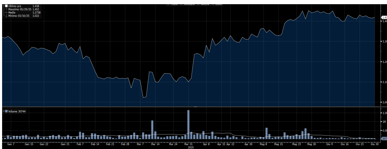
Grafico Performance Expert.ai